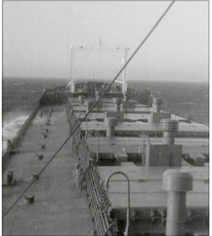
Tässä ollaan menossa täydessä lastissa kohden Eurooppaa ja tietenkin myös smugelitavaran hakua.

Painelin ylös ja siellähän kolleega mönjäili paapuurin luona, vaihdettiin vahti ja mä jatkoin mönjäämistä, se tuli sitten ajallaan valmiiksi ja siirryin styrrpuurin kaapin luo. Avasin oven ja huomasin että oven ja kulkuvalolamppujen väliin oli jäänyt jotain paperia. Otin, utelias kun olin, luulin että uusia ooredereita olisi roskiksen tyhjentämisen yhteydessä lennähtänyt