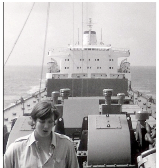
Keulapakalta otetussa kuvassa näkyy tarinan kulkuvalokaapit, etualalla itse kätkön löytäjä.

No, viinat tulivat laivaan yleensä sopivasti ennen uloslähtöä ja ne roudattiin stujun varastoon, mukamas slabiviinoiksi, mutta, kuten yksi sipsu totesikin, ei minkään laivan jengi imuroi sellasta määrää muutamassa viikossa. Mutta eihän se sipsua liikuttanut, hänhän sai rahansa. Ulos lähdön jälkeen viinat sitten roudattiin kofferdamiin ja dunkki ja poosu hoisivat kosmetiikan kofferissa. Minä tein förstin osuuden fyysisestä työstä, olinhan hänen vahtimiehensä, eikä