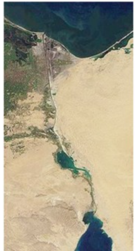
Suezin kanavaa sateliitista.

Päästiin pikkuhiljaa Välimeren puoleiseen päähän ja tulimme sitten Maltalle Vallettan kaupunkiin. Saatiin laiva telakalle ja nostettiin kuiville niin pohjasta kasvoi parikymmensenttistä ruohoa. Ei ollut paljon lähtenyt merimatkan aikana. Ne puhalsivat vedellä ja hiekalla pohjan ja saivat sen aika puhtaaksi.