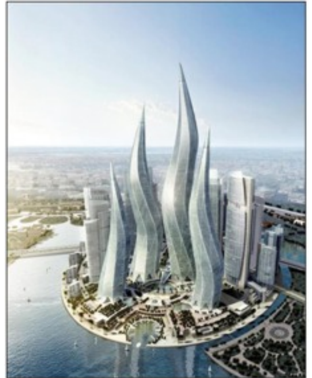
Tämmöistä siellä nykyään on.

Aracuayakin suvaitsi saapua satamaan illalla ja päästiin laivaan ja vaihtoporukka hotelliin.