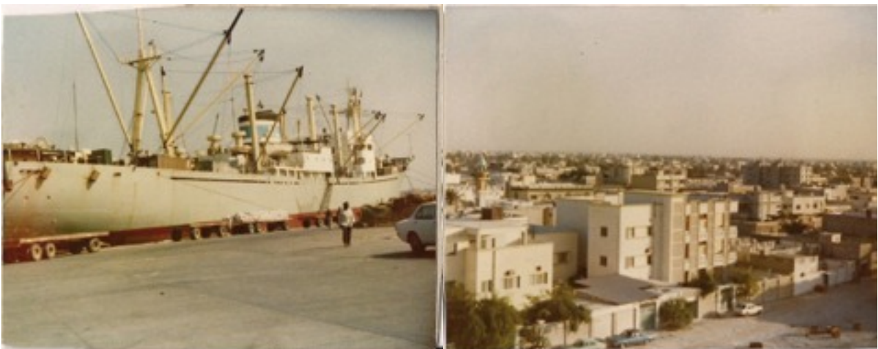
Aracuaya Dubaissa ja oikealla Dubaita silloin 70-luvulla.