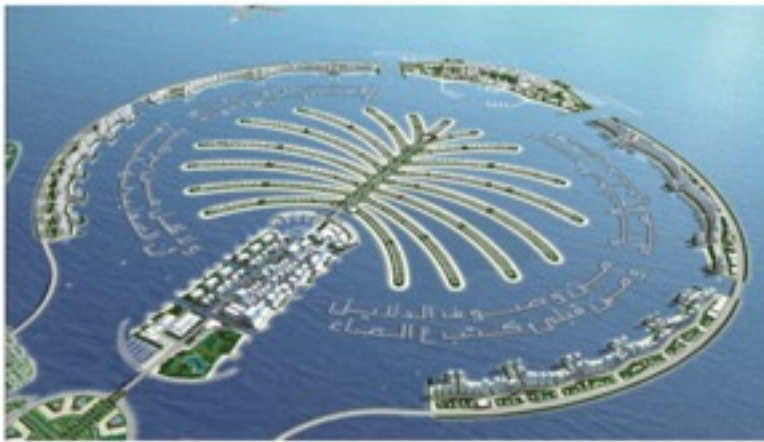
Laguunin muotoon tehtyjä rakennelmia, katu ja taloja.

Tässä on Dubain uusimpia villityksiä. Maksaa satoja miljoonia taaloja rakentaa noita. Laivassa oli lastina pakastelihaa ja kanaa. Myös oli jotain rehun näköistä oli varmaan kameleille tarkoitettu. Muutakin krääsää oli. Siitä jatkettiin vielä matkaa Kuwait Cityyn. Sinne oli loppu jäälästi. Sieltä sitten kolkuteltiin Dar Es Salaamiin Tansaniaan. Sieltä lastailtiin jotain kappale-tavaraa Rio De Janeiroon. Sitten ajettiin Etelä-Afrikkaan Durbaniin ja East Londoniin ja Port Elizabethiin ja Kape Towniin. Kaikista kerättiin jotain kappale-tavaraa Brasiliaan. Kape Townista otettiin myös bunkkeri ja proviantti.