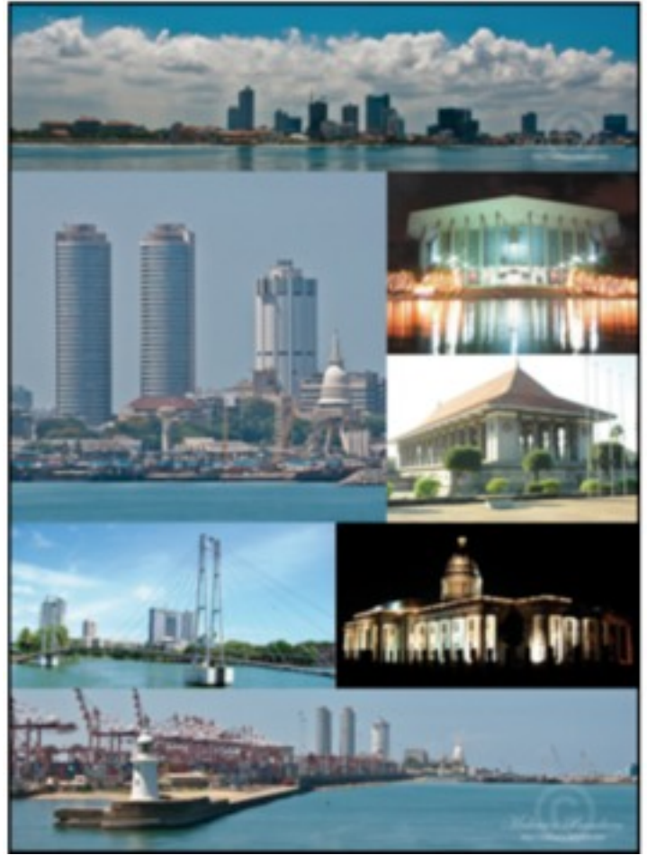
Tässä vähän nykyaikaista kuvaa Sri Lankasta.

Sinne jätettiin loput pakasteet ja osa makeisista. Duunarit kun huomasivat että siellä oli terveysseiteitä myö niin niillä oli hauskaa. Olivat muuten merkiä "Perfekta" Ne repivät niitä pakkauksia auki ja tekivät hikirättejä itselleen. Ei siellä auttanut vaikka kuinka oli olevinaan ruumavahtina niin tekivät mitä halusivat. Sitten kun tuli pakastekanojen vuoro niin ne ottivat sieltä muutaman kanan ja grillailivat niitä siinä täkillä niin Pornoheino meni ja heitti ne kanat mereen ja sanoi että on kielletty. No duunarit kostivat niin että jemmasivat niitä kanoja joka puolelle ja arvaa rupesivatko ne haisemaan. Nää duunarit olivat Pakistanista. Tuli hirvittävä haju niistä kanoista ja kova hakeminen että löydettiin kaikki mätänevät kanat. Kyllä kuuli perämieskin kunniansa kun meni heittämään ne duunareitten kanat mereen. Ei tehnyt suurta lovea lastiin muutama pakastekana. Muuten meilläkin oli ämpärikaupalla niinä karkkeja joita keräiltiin kun duunarit olivat rikkoneet paketit. Sinne meni myös loppu siitä kamelinrehusta. Sitten meillä oli vielä 1000 tonnia tomaattipyreetä ja karkkeja Jeddaan Saudi Arabiaan. Odotusaika perinteisellä rahtilaivalla siellä kuulemma oli pitkä. Purkaus tapahtuisi redillä proomuihin ei vaan ollut tietoa koska. Odottelimme ja